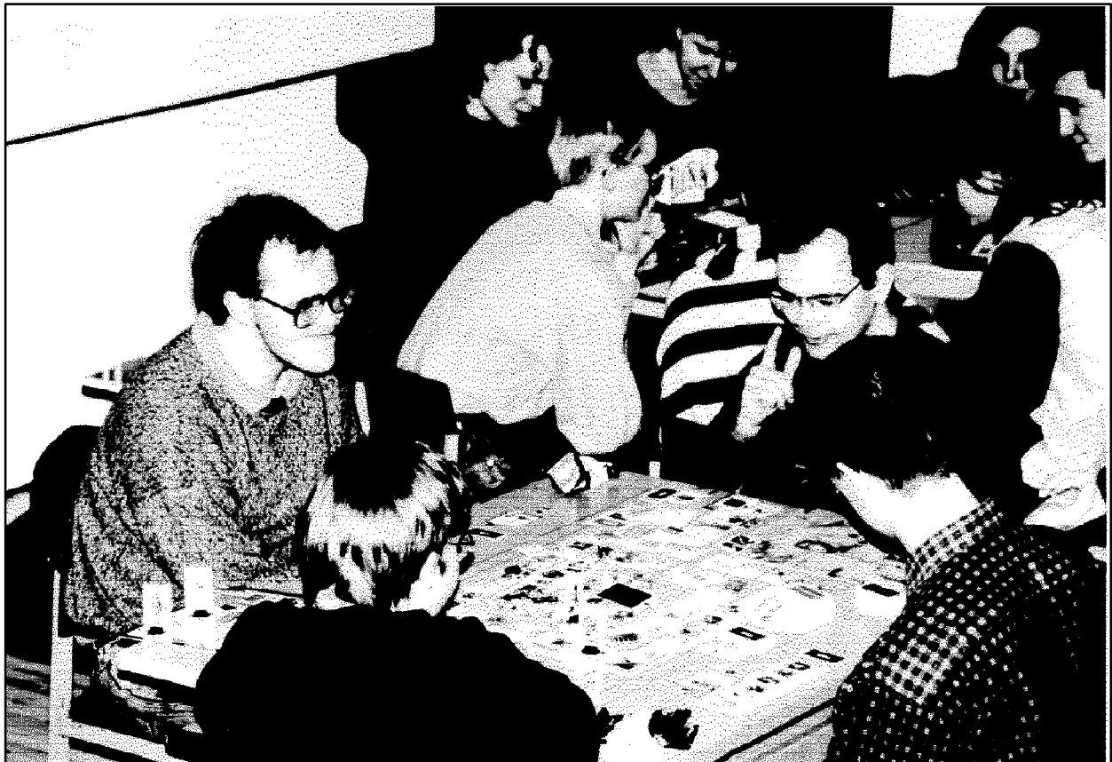
Talisman on aina ollut yksi tapahtumien suosikkipeleistä.

Vai onko todella niin, etteivät roolipelaajat välitä tapahtumista? Ne, jotka väittävät välittävänsä, sanovat niin vain siksi, ettei heidän ulottuvillaan mitään ole järjestetty.