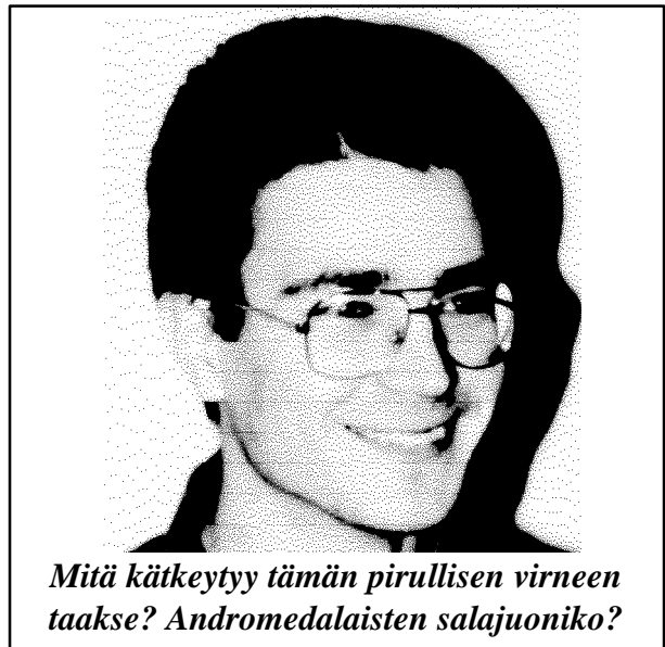
Mitä kätkeytyy tämän pirullisen virneen taakse? Andromedalaisten salajuoniko?

Ikävä kyllä painoteknisistä syistä joutu- en siinä on jonkin verran vanhentunutta tietoa, joka kyllä tosin korjataan seuraa-