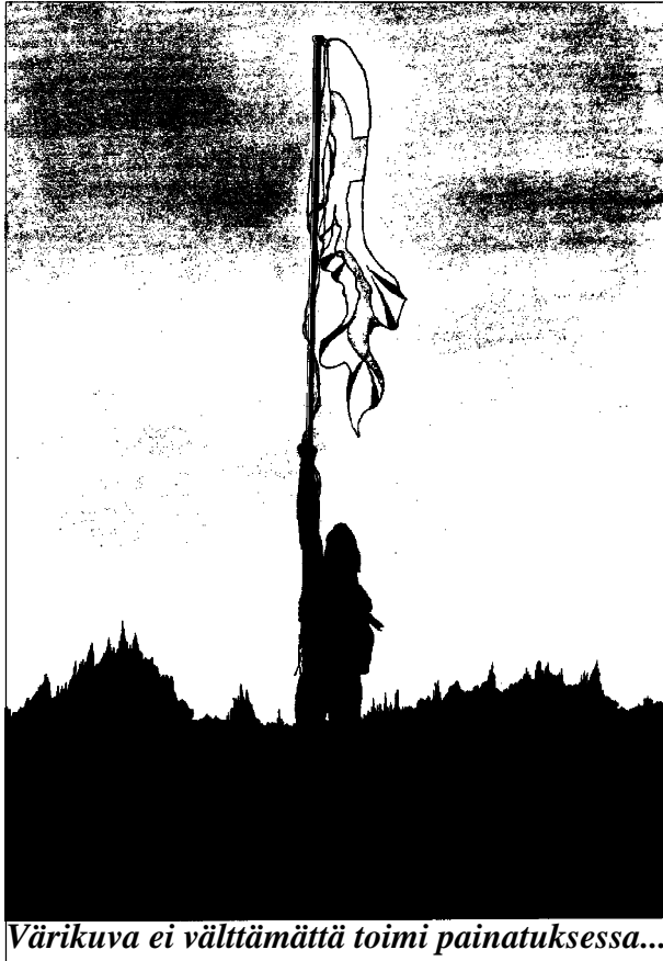
Värikuva ei välttämättä toimi painatuksessa...

File on mieluiten niin sanottua raakaa ASCII:ta, ei lempiteksturisi mitäliefilejä. Kaikki fikset ohjelmat osaavat tallettaa tekstin myös ASCII-muodossa, käyttäkää sitä optiota. Toisekseen, tekstissä ei saisi olla mitään tehokeinoja - siis ei mitään ASCII-simuloituja lihavoituksia, ei keskityksiä, ei edes sisennyksiä, eikä varsinkaan tavutusta. Ainoastaan tyhjä rivi kappaleiden väliin. Jos koet, että jokin tehokeino on ehdottoman välttämätön johonkin kohtaan, laita tekstiin suluissa huomioita asemointiohjeista.